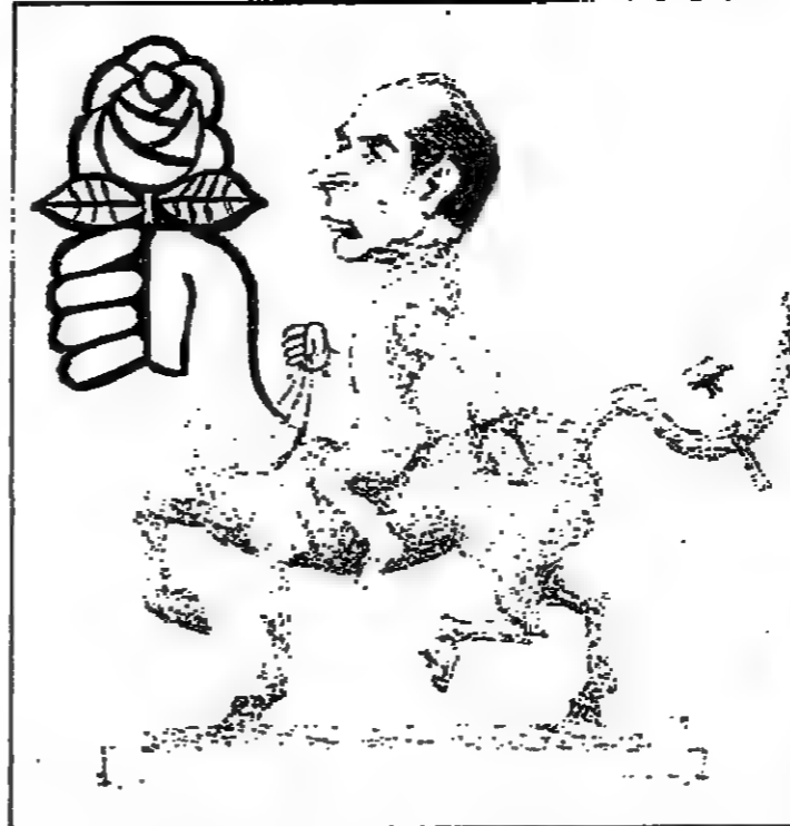
ميران « غارس » للتلف الاذاعي - الموسوعي في فرنسا